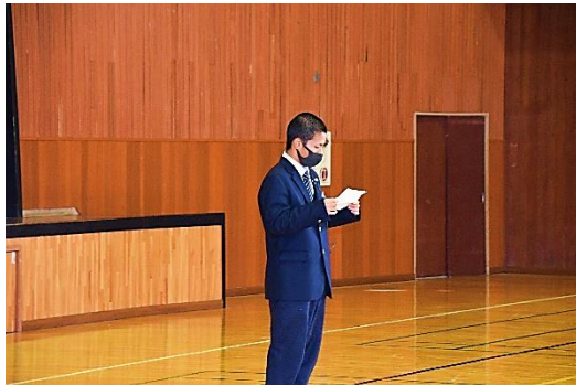
【激励の言葉 真栄城生徒会長】