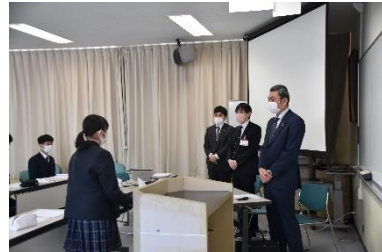
【生徒代表 お礼の言葉】