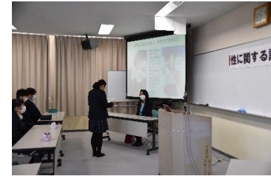
【生徒代表 お礼の言葉】