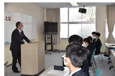
【話に聞き入る生徒】

どの授業においても、生徒は4月からの自分の生活や社会人としての将来に思いを巡らせながら、真剣に話を聴きました。