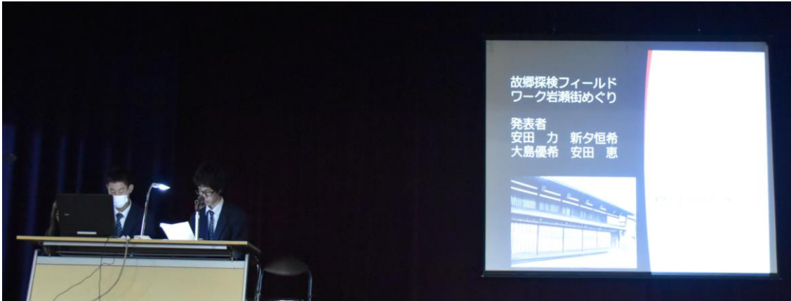
【故郷探検」講座の発表】