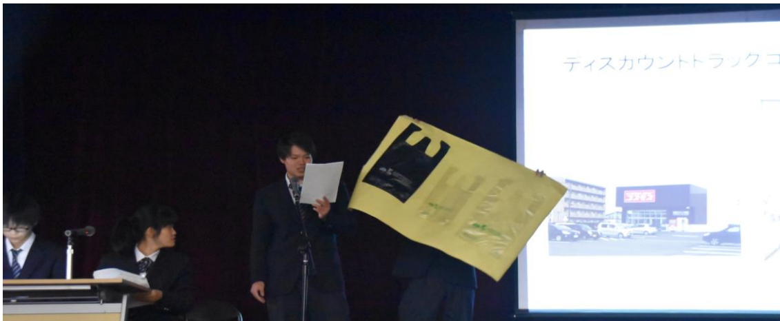
「環境問題」講座の発表】