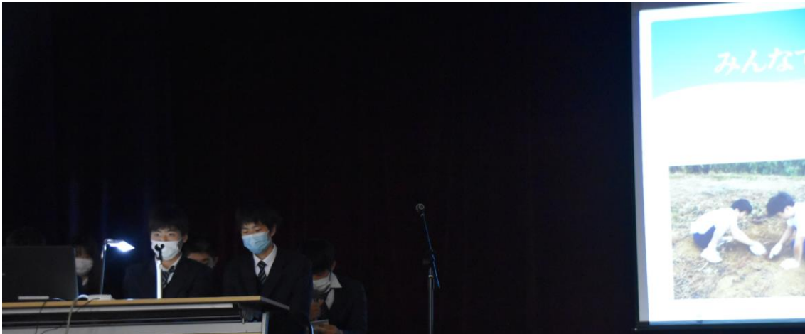
【「高朋農園」講座の発表】