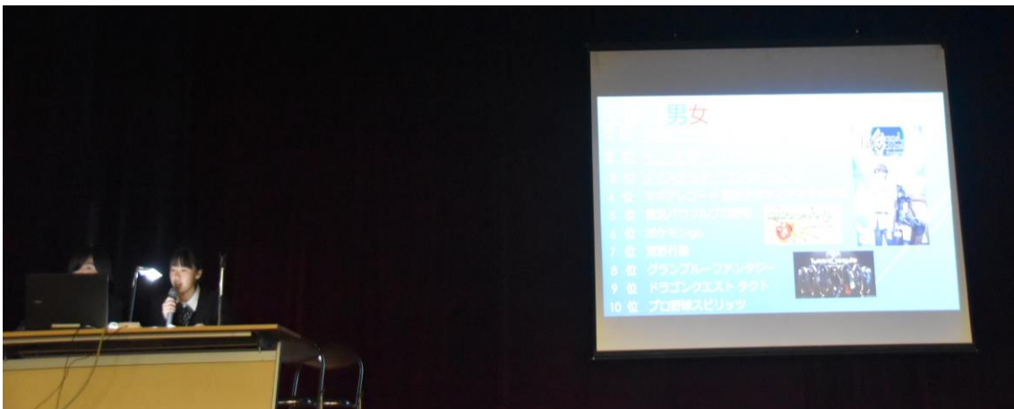
【「情報コミュニケーション」講座の発表】