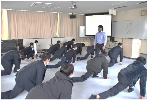
【ダーサリ先生 ヨガ指導】

今日の授業で生徒たちは、各国の特徴や日本の文化との違いを知ることを通して、民族や文化の多様性について、理解を深めることができました。