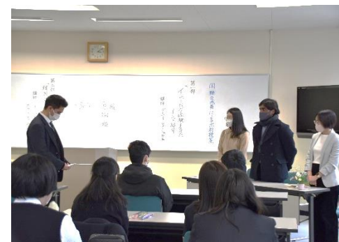
【生徒代表 お礼の言葉】