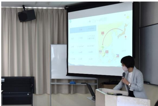
【ホアン先生 ベトナムの紹介】