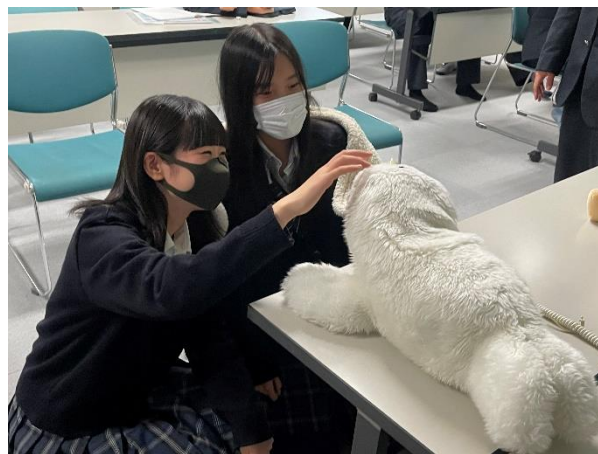
ロボットと触れ合って笑顔を見せる生徒