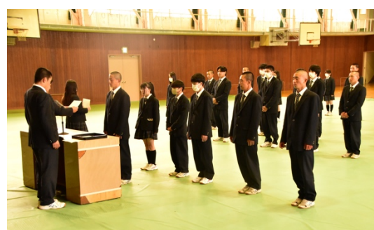
生徒会役員任命式