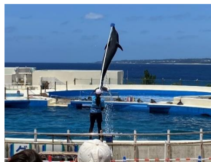
Dolphin jumps high!