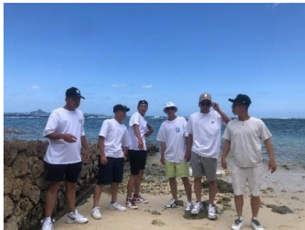
Beach boys Cool!