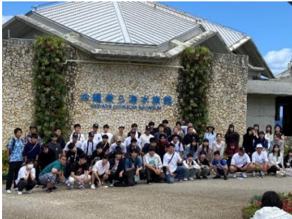
美ら海水族館で集合写真

本日の天候は晴れ。生徒は健康状態もよく、元気に活動を進めています。午前中は美ら海水族館の見学、午後は読谷村体験王国むら咲むらで体験学習を行いました。