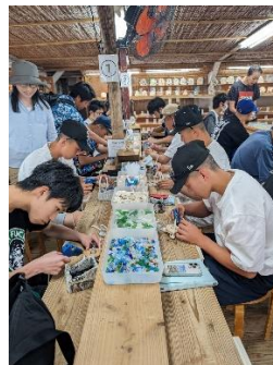
「読谷村体験王国むら咲むら」で体験学習