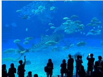
ジンベイザメと広大な水槽