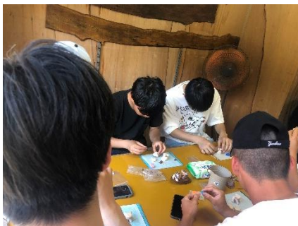
シーサー制作体験