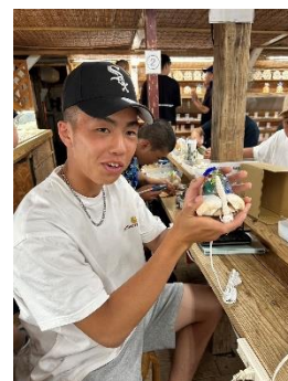
海のランプ制作体験