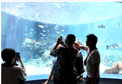
巨大水槽で思い思い撮影