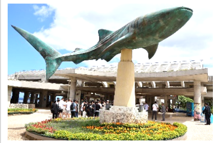
大きなジンベイザメの彫刻