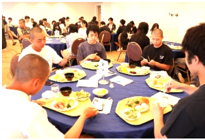
クラスごとにテーブルを囲む