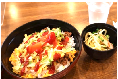
沖縄フルーツランドで 昼食タコライス