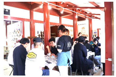
C組 アクアドーム制作