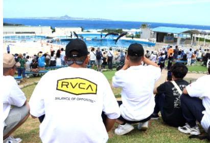
イルカショーを見学