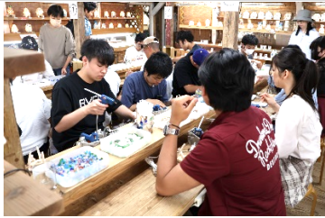
B組 海のランプ制作