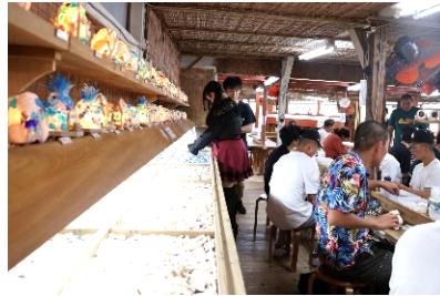
シーグラスやサンゴを選ぶ