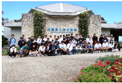
美ら海水族館前 全員で記念撮影