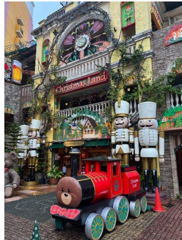
【3日目 北谷アメリカンビレッジ】