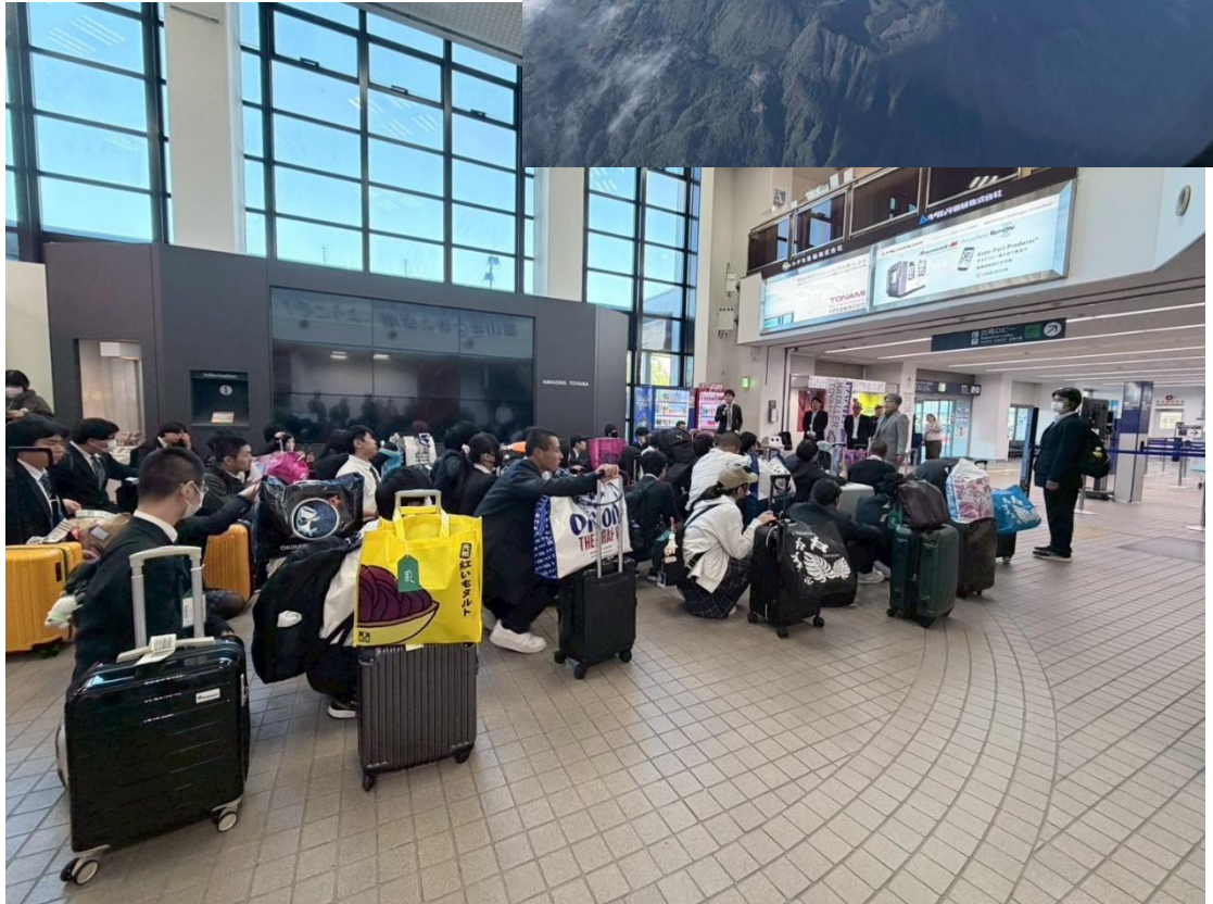
【4日目 那覇空港から富山空港】