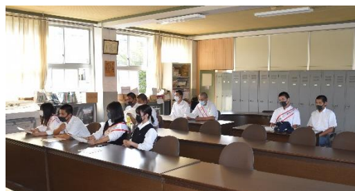
【立会演説会に臨んだ候補者と応援者】

なお、17日（金）の全校朝礼で認証式を行い、その後、執行部の組織づくりに取りかかります。