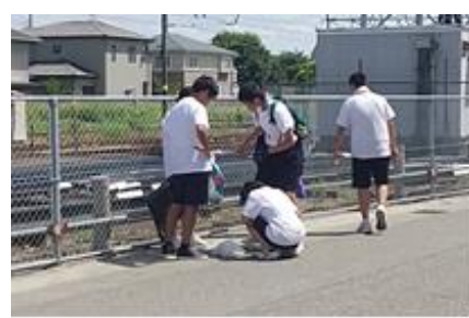
【東富山駅付近の清掃（1年生）】