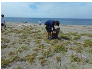
【岩瀬浜の清掃（2、3年生）】

1年生は、学校から東富山駅の間を、2、3年生は、岩瀬浜の清掃をしました。暑い日でしたが、生徒は熱中症に注意しながら一生懸命に活動しました。