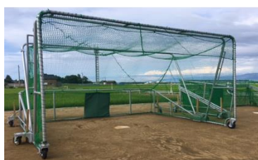
【バッティングゲージ】