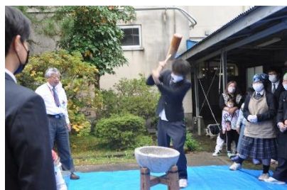
【高朋農園米を使って餅つき】