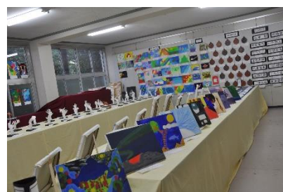
【芸術教科の作品展示】