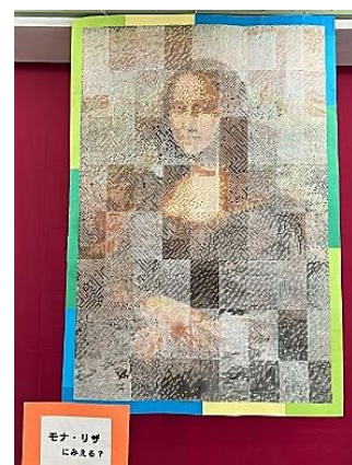
2年生・展示 (モザイクアート)