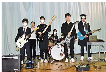
軽音楽部・ステージ発表