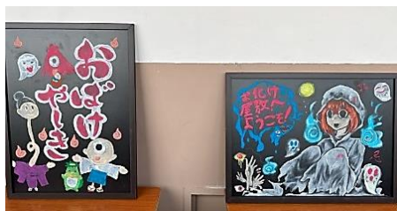
1年生・展示 (黒板アート)