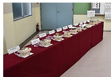
後援会・作品展示