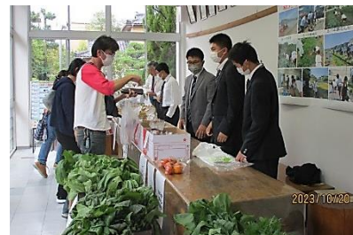
高朋農園・野菜販売