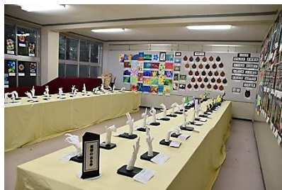
美術科・作品展示