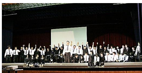
3年生・ステージ発表